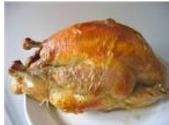
Un poulet roti