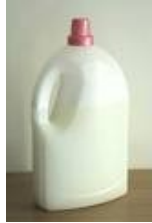
Un bidon de lessive