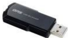
Une clé USB