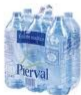
6 bouteilles d'eau de 1,5 l