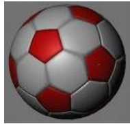
Un ballon de foot