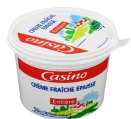
Un pot de crème fraîche