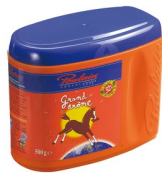
Une boîte de chocolat en poudre