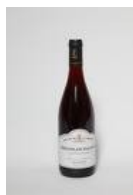
Une bouteille de vin