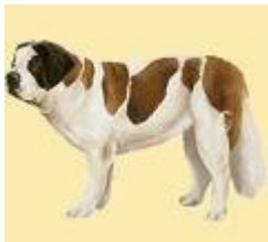
Un gros chien