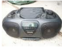
Un appareil à musique