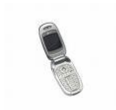
Un téléphone portable