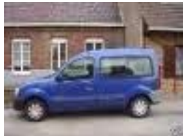
La voiture kangoo bleue