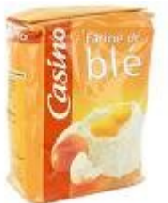
Un paquet de farine