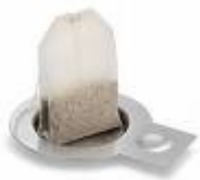
Un sachet de thé