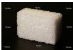
Un morceau de sucre