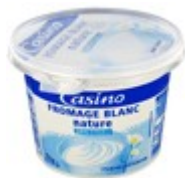
Un pot de fromage blanc