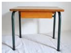
Un bureau à l'école