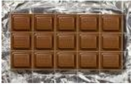
Une plaque de chocolat