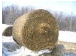
Une balle ronde de paille