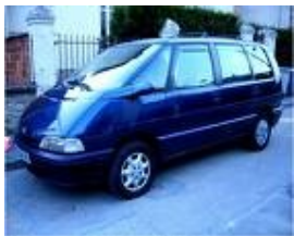
Une voiture « Espace »