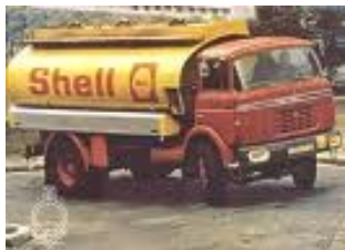
Un camion essence