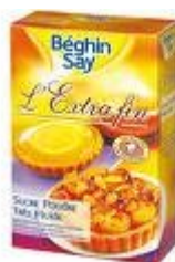
Un paquet de sucre