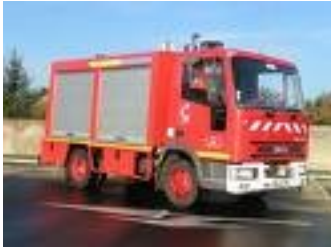
Un camion de pompier