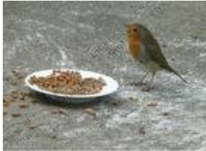
Un petit oiseau